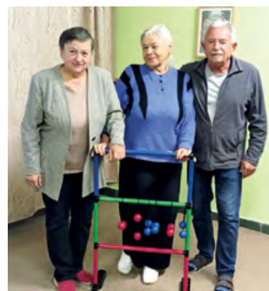
Tři nejlepší v turnaji Bollo Ball – vítězka uprostřed.