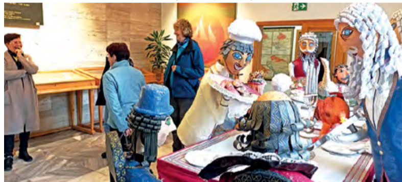
V úchvatném papírovém království.