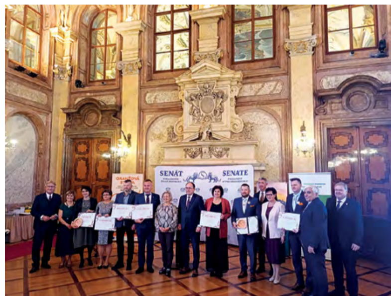
Z návštěvy Senátu Parlamentu České republiky u příležitosti slavnostního vyhlášení výsledků celostátního kola Oranžové stuhy Vesnice roku 2025.