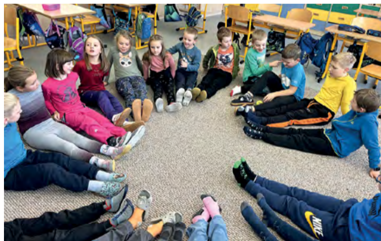
Odpocinek na koberci.