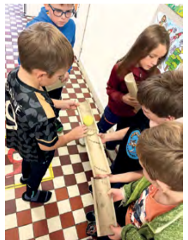
V zápalu hry.