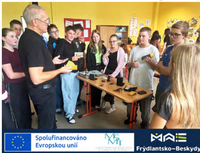
Spolufinancováno Evropskou unií | Frýdlantsko-Beskydy