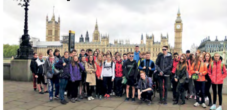
Společná fotovzpomínka žáků ZŠ TGM na Anglii 2017.

Ráno o půl osmé snídaně. Výběr rozmanitý, většina z nás zkusila „full English breakfast“ (párek, fazole, houby a vejce s toastem). Nemělo to chybu. Rychle se sbalil a šup na vlak. Z vlaku na metro a už jsme byli v centru Londýna ve Westminsteru. Památky frčely jedna za druhou – Big Ben, Houses of Parliament, Westminster Abbey, Buckingham Palace... Velice poutavé bylo vyprávění naší průvodkyně o královně Alžbětě matce, Jiřím VI., králi Edvardovi, Alžbětě II. Hodně příběhů z jejich soukromí. Naprosto něco jiného než ve škole. První jízda double-deckerem. Strašně rychle uplynul náš první den. A večer nás čekala večere v typicky anglické a kouzelné „pub“ hospůdce. Chutný hamburger s kuřecím steakem a spoustou hranolků.