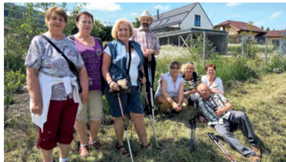
Zátiší s kopretinami cestou do Pstruží