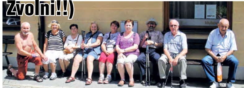
Na místě srazu před vycházkou

Prázdniny zahájíme pátečním výšlapem z Podolánek na Martiňák, pak nás čeká Lázeňské bubnování v BRC, výlet z Frýdlantu do Pržna, tradiční vycházka k vyletlní hospůdce U Zdeňka a měsíc zakončíme pátečním výletem lanovkou na Pustevny. Kompletní program na měsíc červenec najdete jako obvykle v Čeladenském zpravodaji, v klubu, v infocentrech Čeladná a Pstruží nebo na www.seniorceladna.cz.