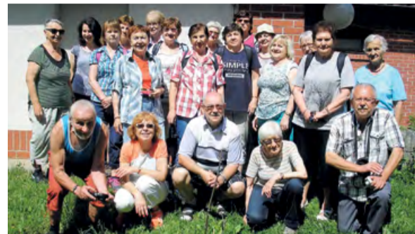
Ostravská výprava z Gabriela před naším klubem