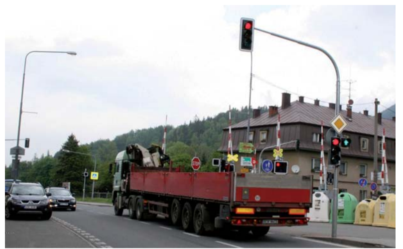
Nová světelná křižovatka zvýší bezpečnost řidičů i chodců.

Nezapomenete si poznamenat do svých diářů, že Den obce Ostravice se tento rok bude konat 11. července v areálu hřiště TJ Sokol. Také letos se mohou děti těšit na různé soutěže a dospělí na spoustu zábavy. Podrobný program přineseme v příštím čísle.