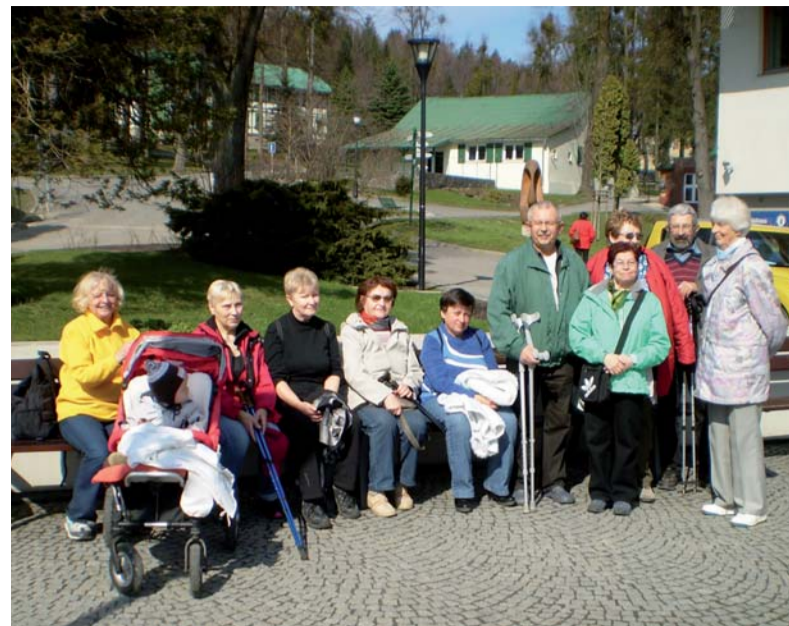
Na sluníčku před Larou.