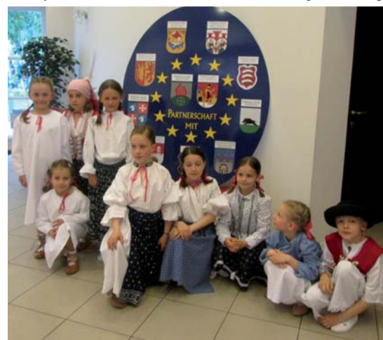
Členové Chasičky z TGM v květnu nejen zazpívali a zatančili maminkám, ale vítali i vzácné hosty jubilejního Setkání evr. Frýdlantu.