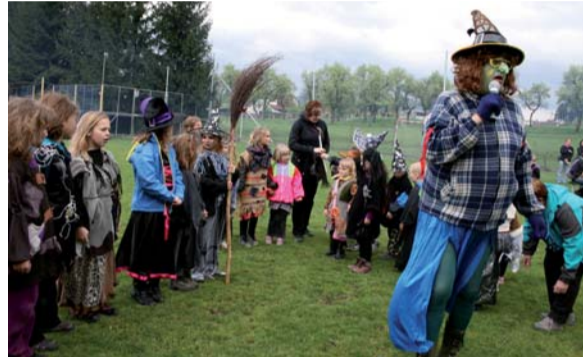
Čarodějnice se chystají na společný čarodějní tanec.

testy maminek líbila asi nejvíce. Odměnou za statečnost i um byly sladkosti či voňavé perníčky. Zájemci si také mohli opět „červa“ na ohni.