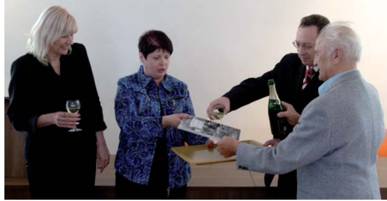
Z prezentace publikace Budujeme Slezsko.