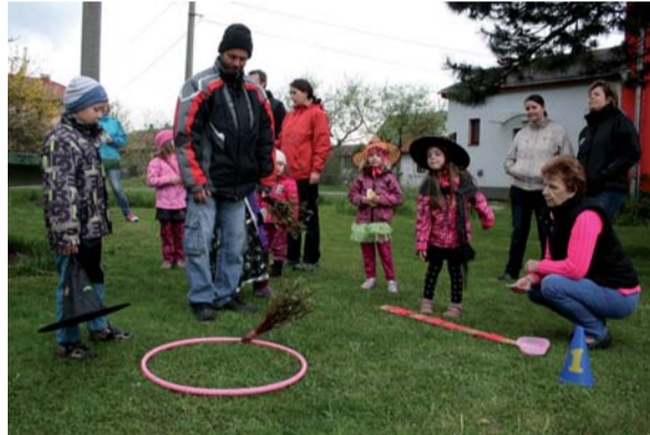
Při stavění májky proběhl zároveň slet čarodějnic.