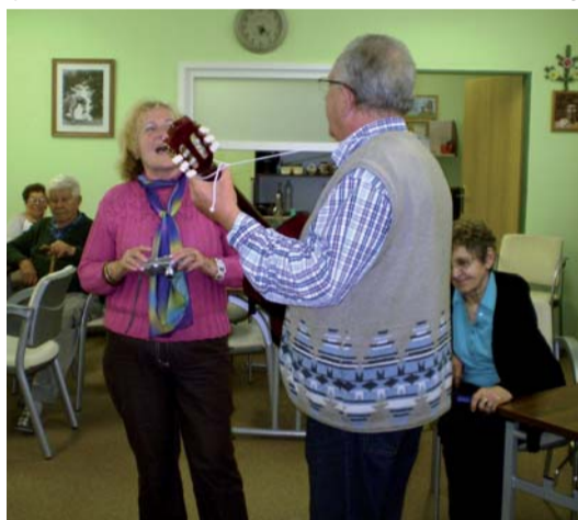
Po skvělé vaječince trochu zpěvu.