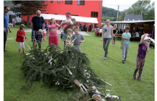
Když májku skáceli, děti oslavily také svůj svátek.