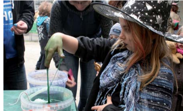
Sáhnutí do slizu a vytáhnutí hmyzu dalo mnohým dost zabrat.