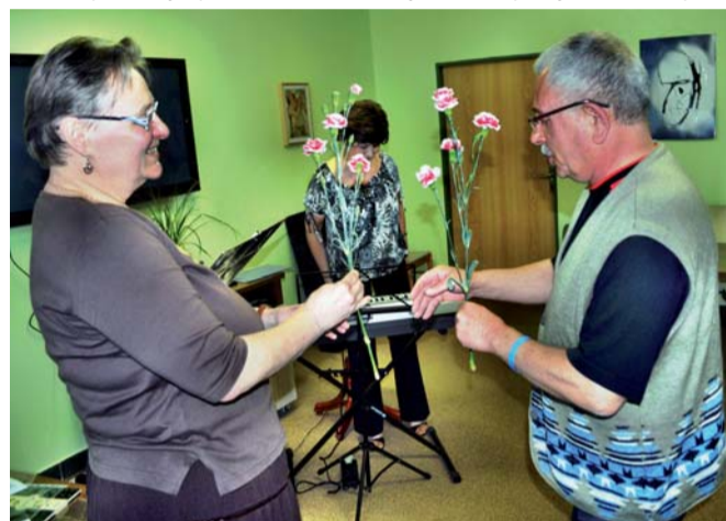
Umělkyním díky za krásný zážitek.