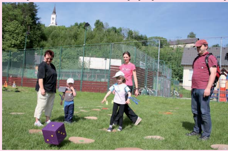
Poslední květnový den se konal v Malenovicích Dětský den. Počasí vyšlo na jedničku a děti se bavily při plnění úkolů nebo v mobilním planetáriu. Dospělé pak zase čekalo smažení vejčiny a oblíbené kácení máje.