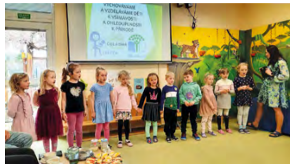
Děti z MŠ Beruška nám zazpívaly písničku o tom, jak se správně třídí odpady.