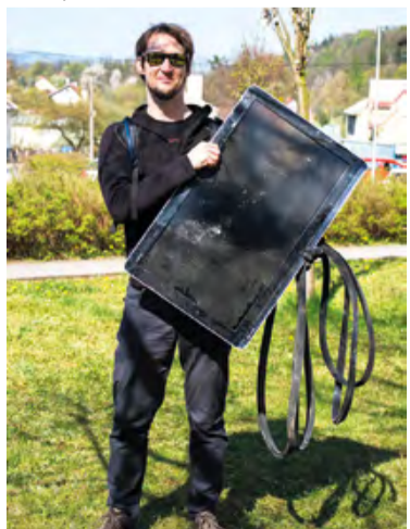
Nejkurióznějším nálezem byla televize odhozená v potoce Řička.