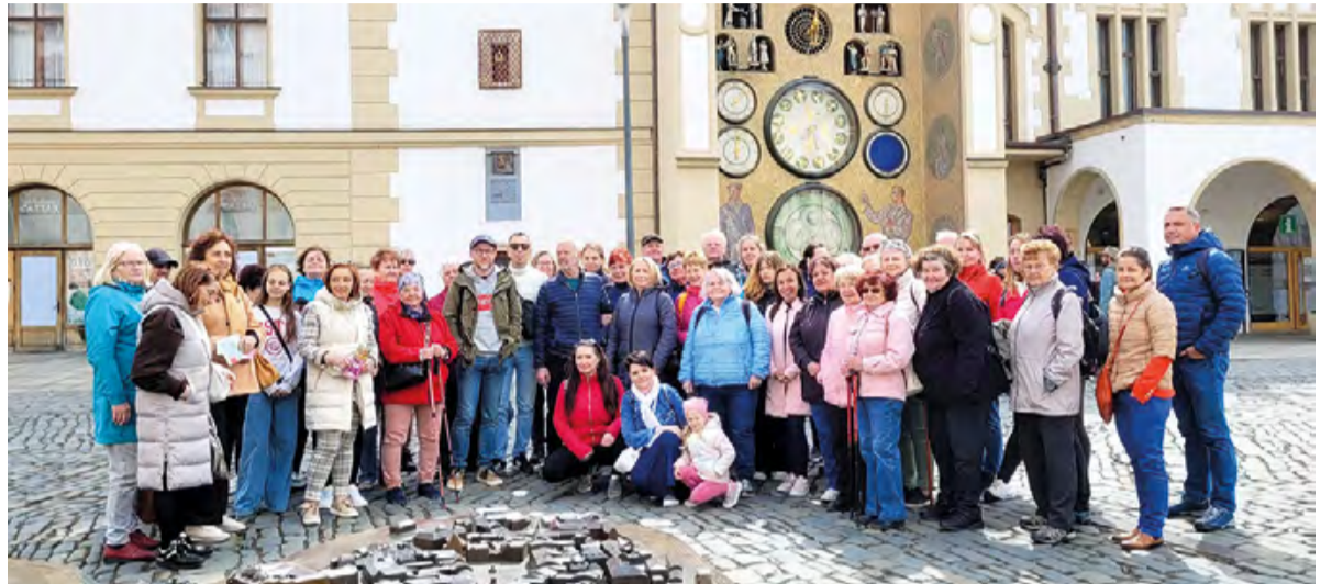
V dubnu jsme vyrazili na zájezd na Floru Olomouc, vynechat jsme pochopitelně nemohli ani místní orloj.

Na cestu zpět vyrazili malenovičtí cestovatelé plni dojmů a obtěžkáni sazenicemi až v podvečerních hodinách. Ale stálo to za to a všichni se už teď těší na další výjezd. Ten je plánován na září a jeho cílem bude (zase po nějaké době) vrchol Lysé hory.