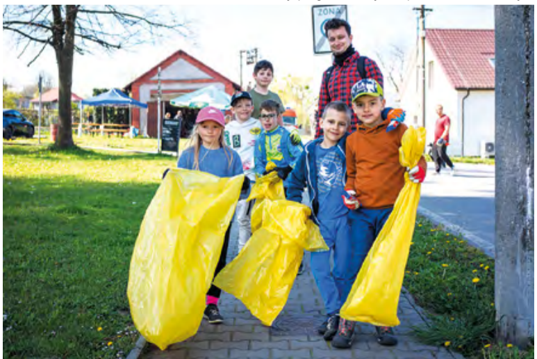
Akce se aktivně zúčastnilo 620 dobrovolníků.

Akce tak opět ukázala, že zájem o přírodu může jít ruku v ruce s příjemně stráveným dnem pro celou rodinu.