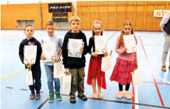
Ocenění výtvarníci v 1. kategorii.