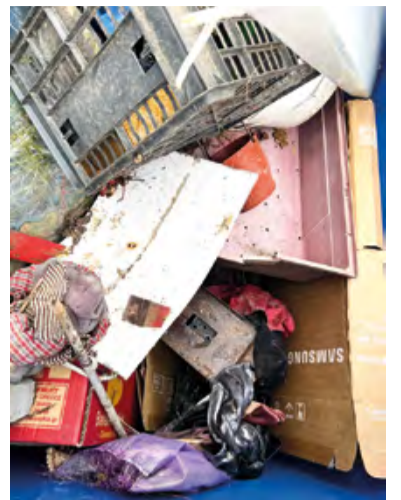
Takto určitě ne!

Zároveň připomínáme, že každý občan může využívat služeb sběrného dvora. Právě tam patří objemný a nadměrný odpad, který nelze vytřídít ani vložit do běžné nádo-