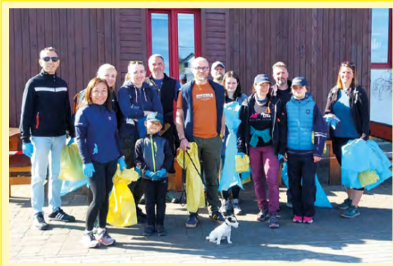
Také letos jsme poslední dubnovou sobotu věnovali dobrovolnickému úklidu Malenovic. Děkujeme všem, kteří se zapojili!