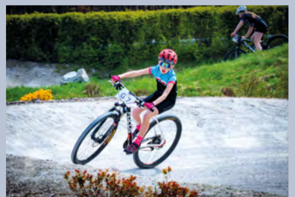
Kohouti Pržno uspořádali 19. dubna první závod horských z letošního cyklu Japa Cup 2026. Počasí přálo a na trať postupně vyrazili nejmenší bajkeři, až po ty nejstarší, po veterány. Nálada byla vynikající a diváci byli svědky fantastických výkonů.