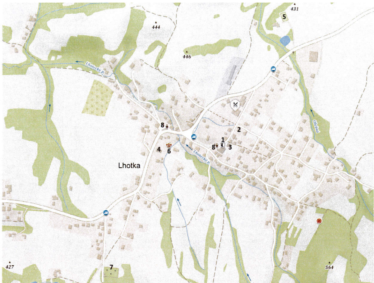
Obrázek 1 Mapa obce občanské vybavenosti