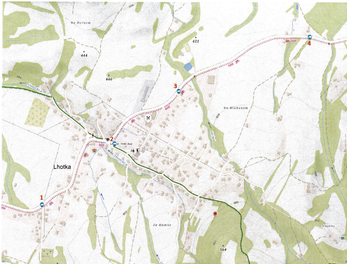
Obrázek 3 Mapa veřejných zastávek