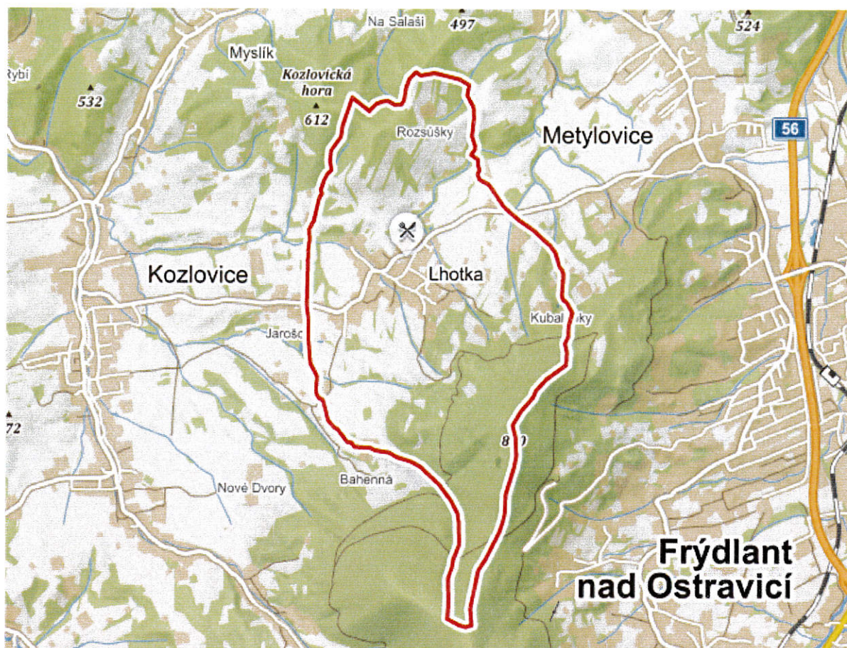
Obrázek 2 Vyznačení katastru obce Lhotka