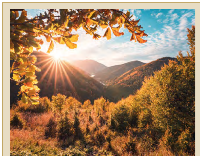
Podzim nad údolím Řečice...