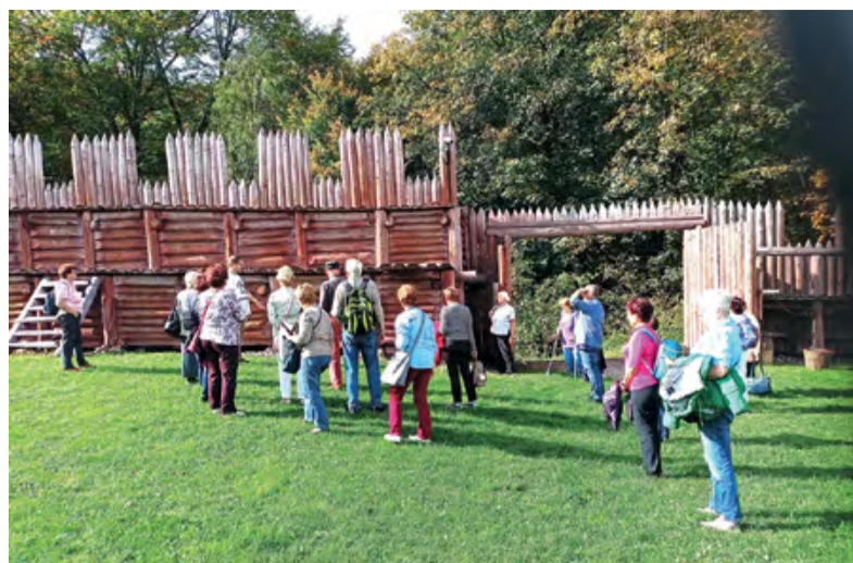
Komentovaná prohlídka hradiska.